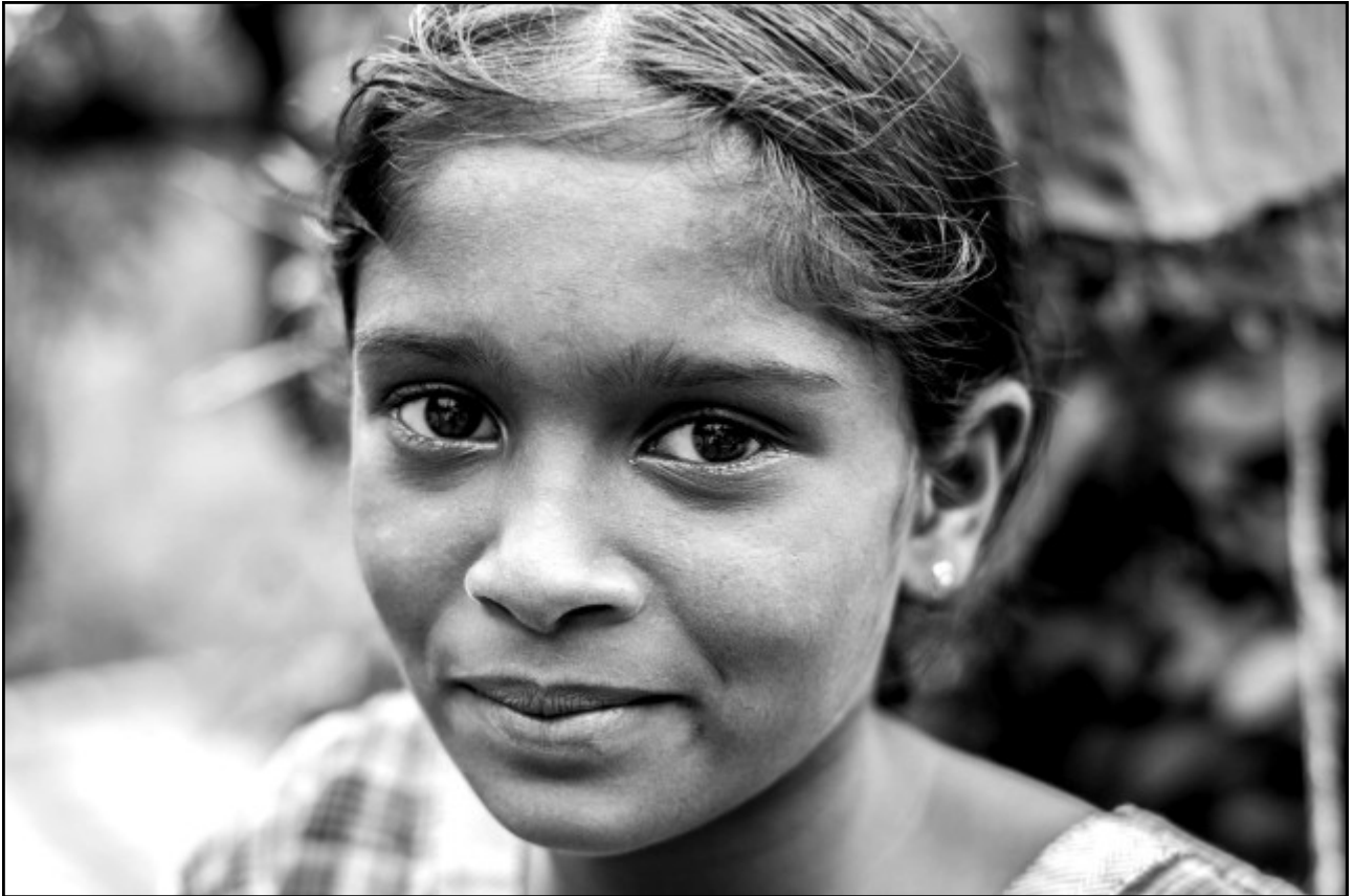
Fille d'un employé de la plantation Newburgh.