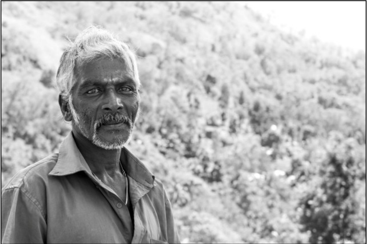
Employé de la plantation de thé Finlays. De même pour les deux images suivantes.