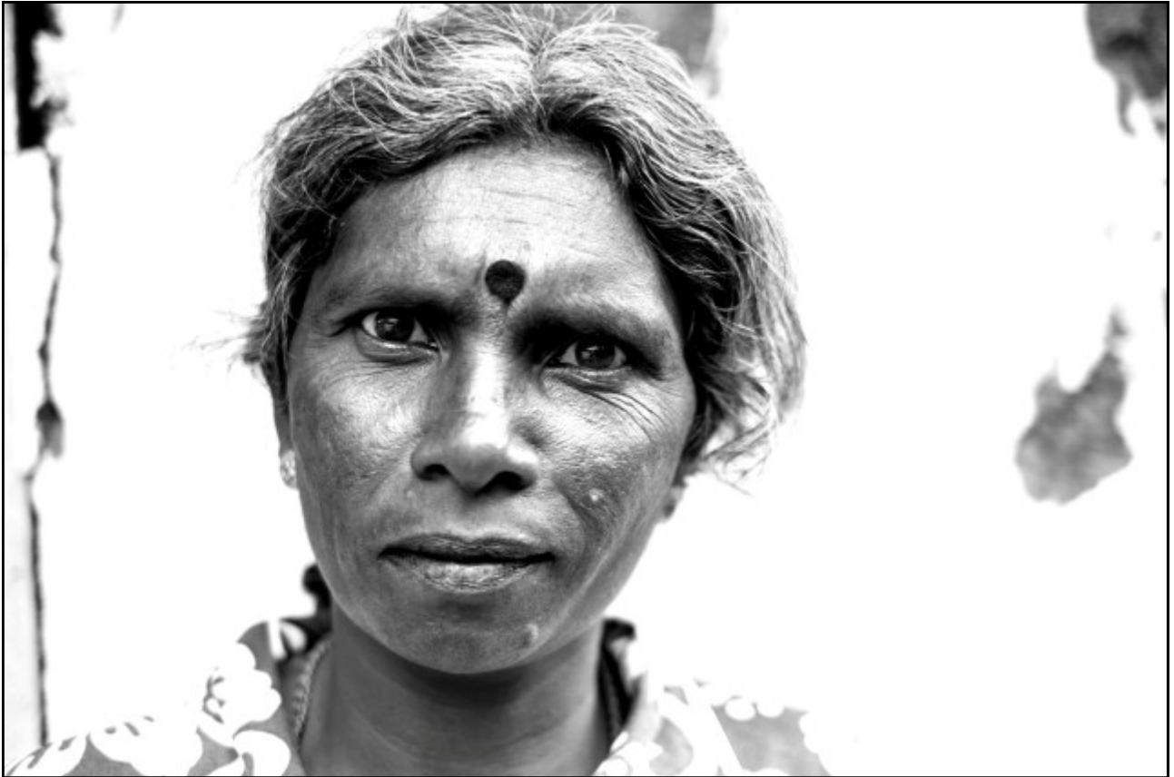
Employée de la plantation Newburgh.