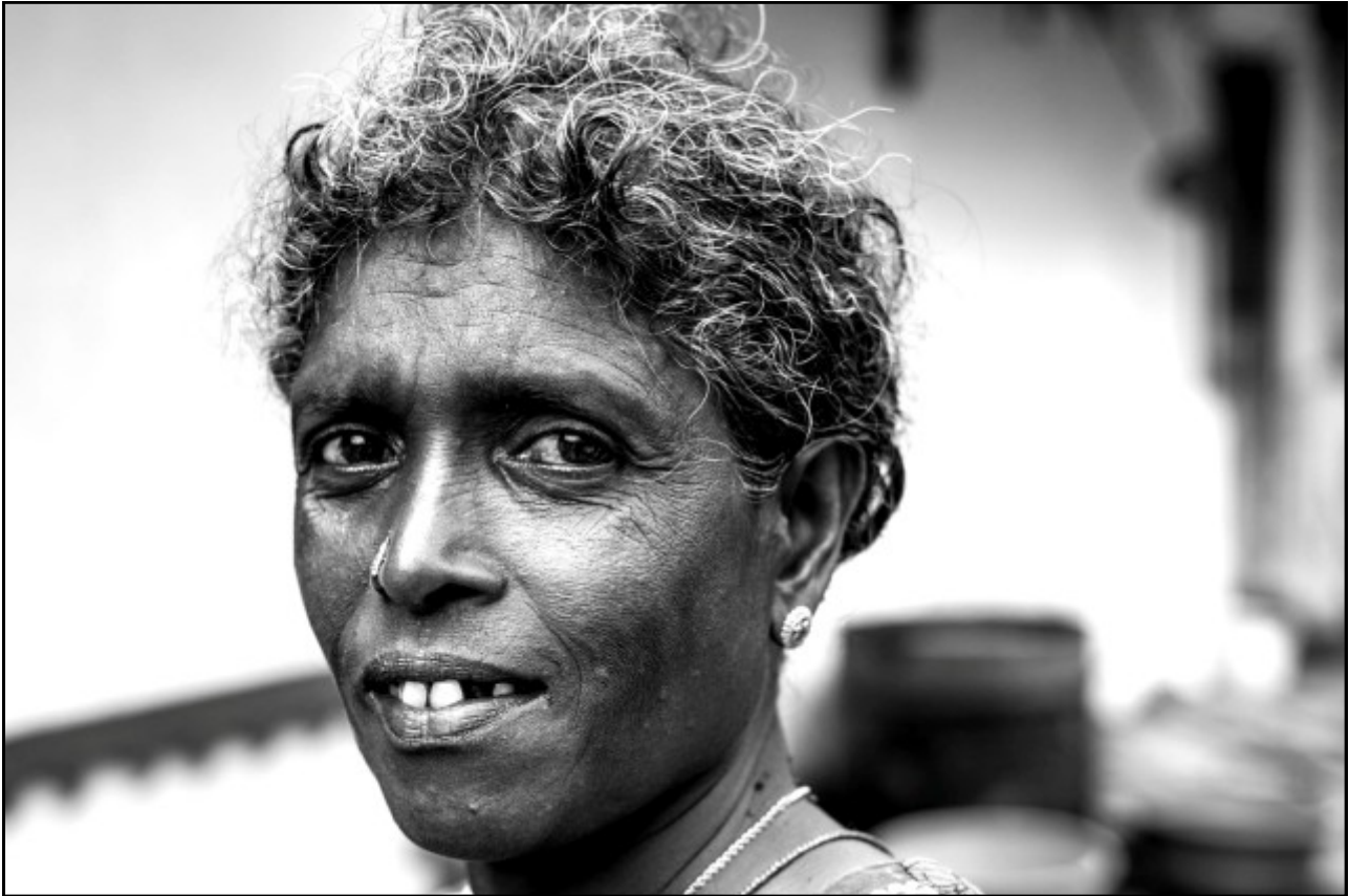
Employée de la plantation Newburgh.