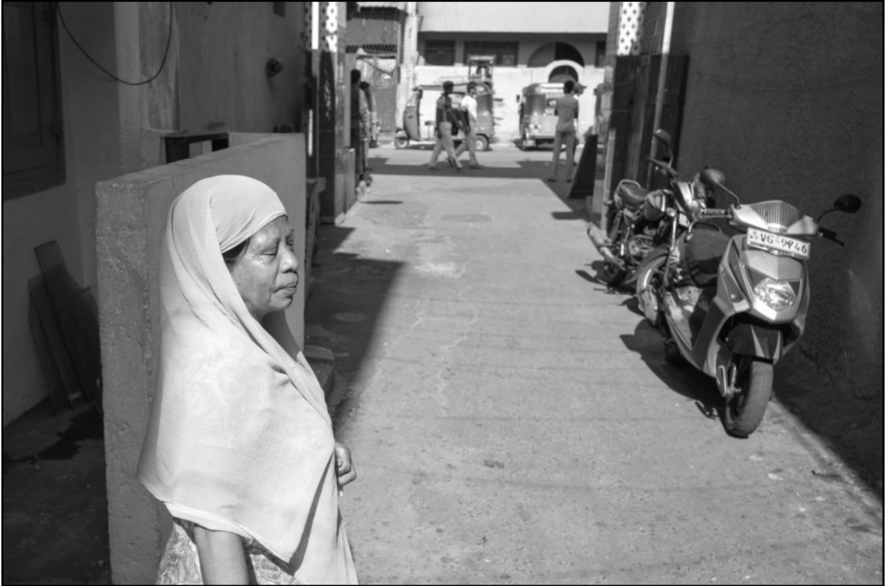
Une femme ferme les yeux en marchant, comme dans un rêve.