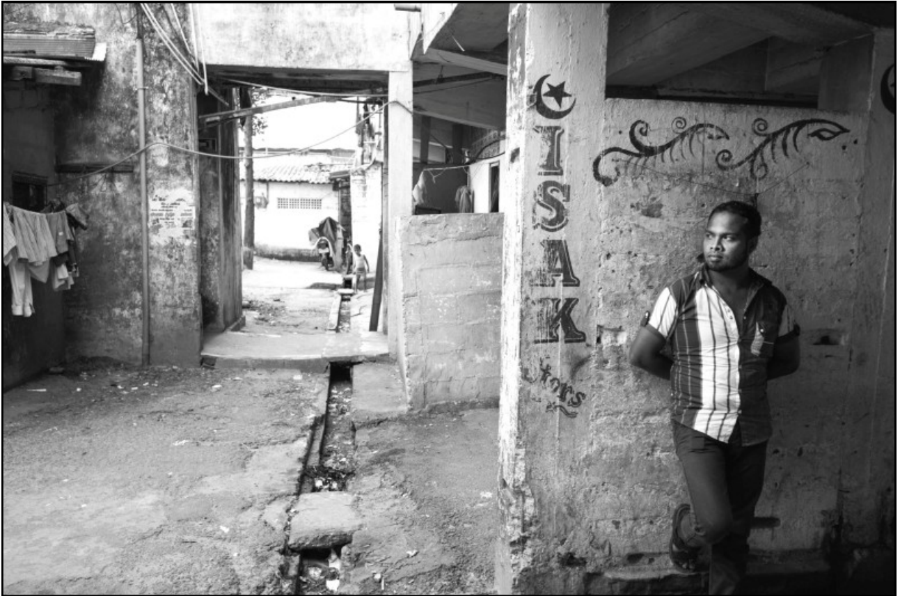
Un type attend que le temps passe dans une cité d'habitat collectif.