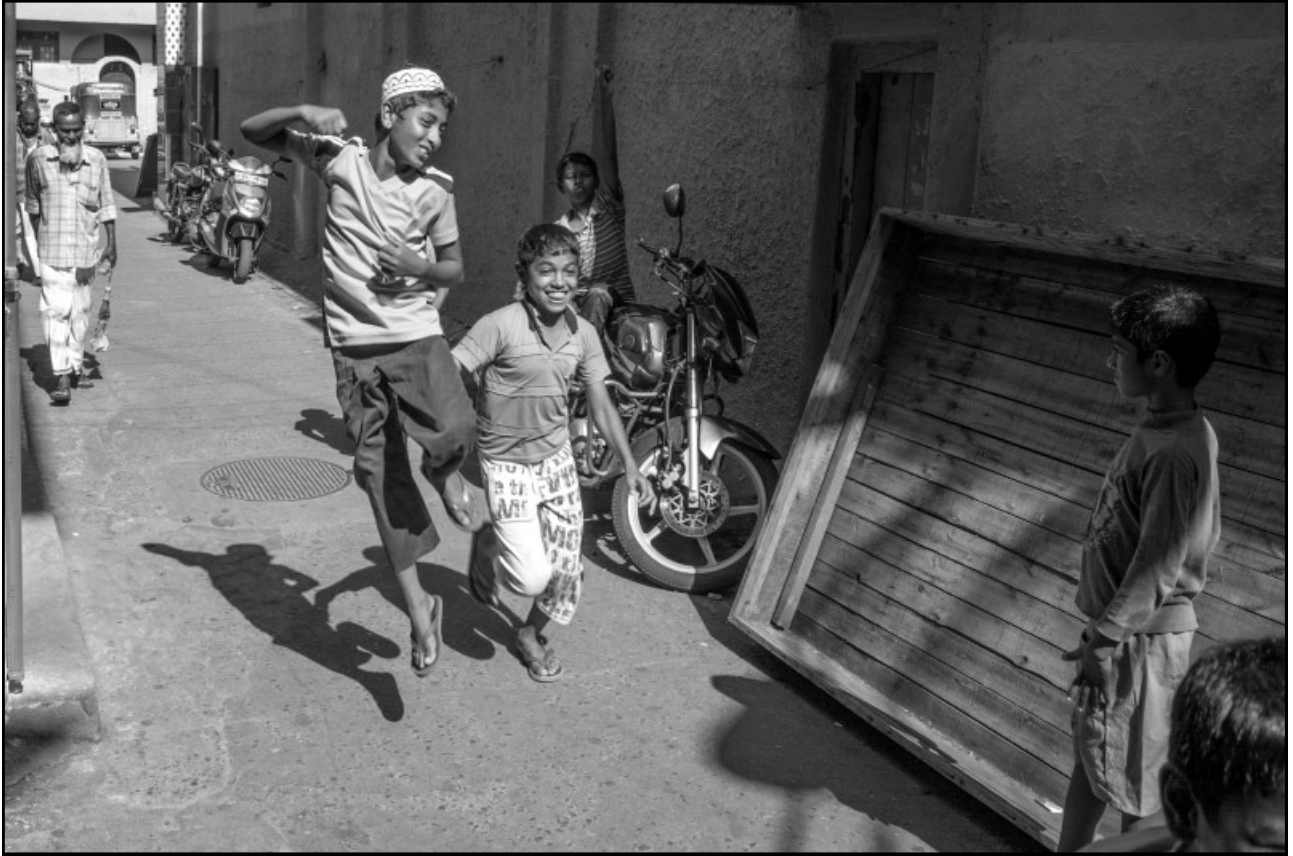
A Slave Island, des enfants jouent au cricket dans une ruelle, près de la mosquée et sautent de joie lorsqu'ils marquent un point, comme lorsque le Sri Lanka parvient à battre les Anglais.