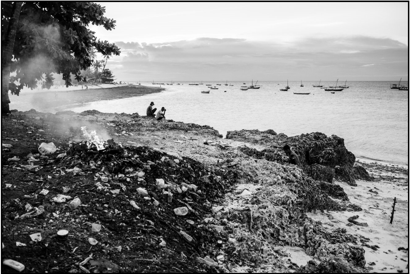
La décharge de la plage est à une encablure du premier hôtel, on y brûle les déchets des touristes. Chez les pauvres, les déchets sont minces.